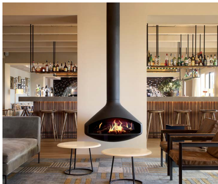
ERGOFOCUS HOLOGRAPHIK® ©DOMINIQUE IMBERT