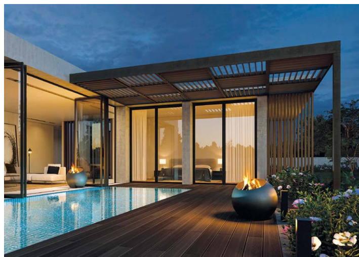
BUBBLE® ©CHRISTOPHE PLOYE