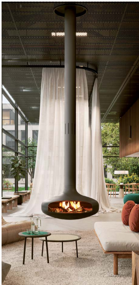
DOMOFOCUS BIOETANOL ©DOMINIQUE IMBERT

Aunque siguen destacando por levitar sobre el suelo, ahora sus llamas funcionan con bioetanol.