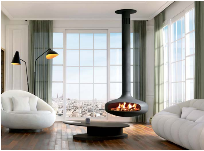
DOMOFOCUS BIOETANOL ©DOMINIQUE IMBERT