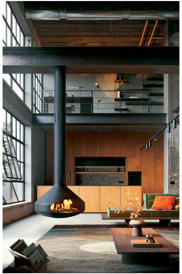
ERGOFOCUS BIOETANOL ©DOMINIQUE IMBERT