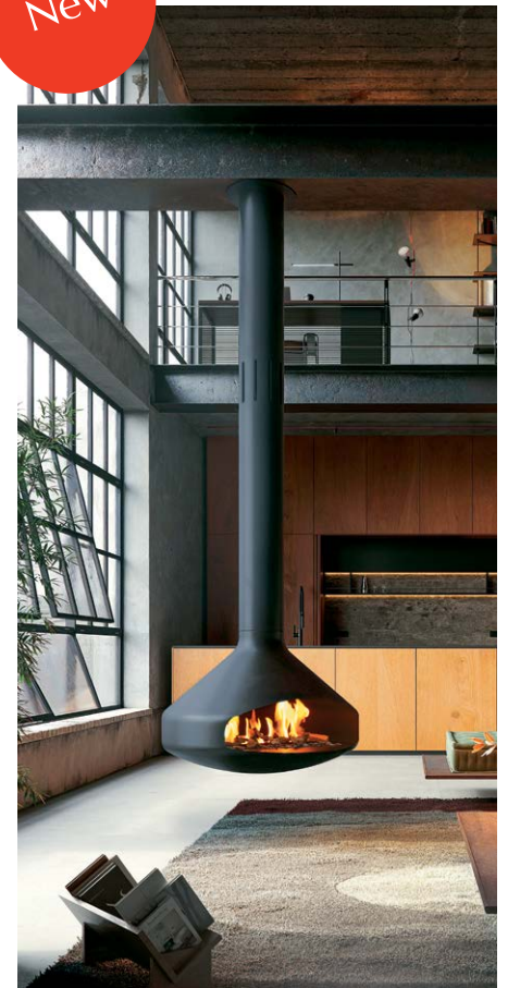
ERGOFOCUS BIOETANOL ©DOMINIQUE IMBERT

2024 es y habrá sido otro año excepcional para Focus con la llegada de su nueva gama de bioetanol que va transformando el panorama de las chimeneas contemporáneas. Los modelos Ergofocus, Gyrofocus y Domofocus , tan elegantes como siempre con su diseño flotante, ahora se encienden con bioetanol.