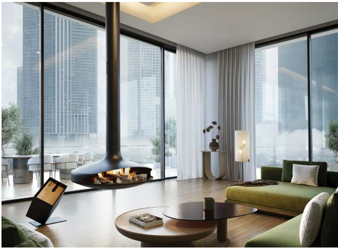
GYROFOCUS BIOETANOL ©DOMINIQUE IMBERT