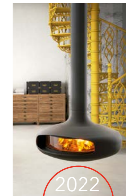
2022 DOMOFOCUS Acristalado

FOCUS también se esfuerza por adaptar sus modelos más emblemáticos para que cumplan con la nueva legislación europea. El objetivo es respetar el Reglamento de diseño ecológico ECODESIGN 2022, pero también conseguir las famosas "stelle" (estrellas) italianas, o sea, la normativa más estricta en el mercado.