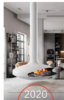
2020 GYROFOCUS Gas