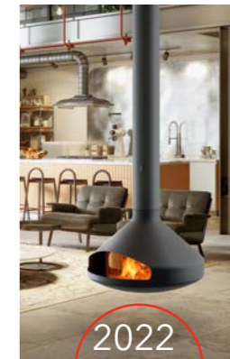
2022 ERGOFOCUS Acristalado