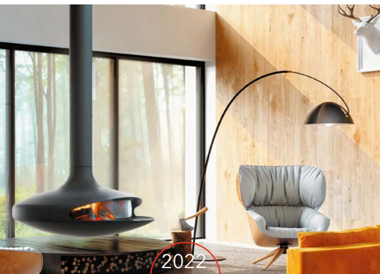
2022 GYROFOCUS Acristalado

En los últimos años, FOCUS ha desarrollado la introducción en el mercado de nuevos productos que va creando cada vez a un ritmo mayor.